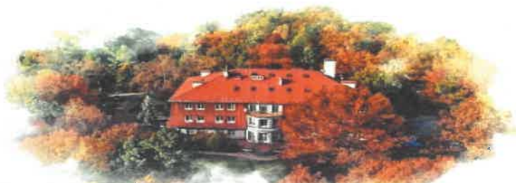
Dom Pomocy Społecznej im. Jana Pawła II w Głownie

95-015 GŁOWNO ul. Karasicka 51 tel. (042)716-43-77, 716-30-01 tel./fax (042) 719-41-65 www.dps.glowno.pl mail: dps@dps.glowno.pl